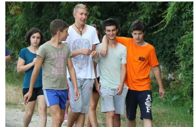
Equipe d'animation de l'an passé (roumains et français)